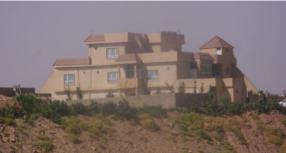
خانوهه كه ی عوسمان بانى مارانى له كۆیه

• ئەم وینانهی له بهرچاوتانه وینهی قهسر و دهواجن و مه تهعمه كه ی عوسمان بانى مارانین، ئەو عوسمان بانى مارانیهه ك كه هه تا كاك نهوشىروان له ناو یه كى تیدا مابوو خۆى ناوى لىئابوو (عوسمان بانى تالانى!) چونكه ئەوهنده ی